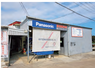
奥へ長く続く事務所は、多くの会議室が並びます