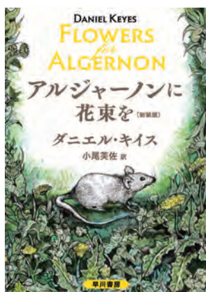
小尾美佐 訳：早川書房

この本は二十年ほど前に友人から頂いた本です。福祉という業種で仕事をしている関係でも興味深く、頂いてすぐに読み始めました。今回、何を紹介しようかと本棚を探したところ、この本が目にとまりました。 頂いた時は新品だった本が、二十年前ぶりに手に取ると表紙は色褪せ、ペー지를捲ると紙面は薄茶色になり、所々にシミがついています。当時は主人公の心情に入り込んで色々考えた一冊だったと記憶していません。(いろいろ考えたことは忘れましたが・・) 少しネタバラシをしますと、六歳の知能を持った三十二歳のチャーリー・ゴードンが、ある研究に協力し超知能を手に入れてからの愛や喜び、憎しみ孤独を通して人の心の真