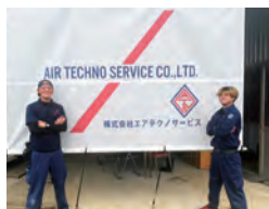
社員の皆さんの「自信」が 感じられます

「作業は「キレイ」ではなく、「丁寧」に。そう語る大島社長と社員が作るエアテクノサービスという名の技術者集団は「ありがとうの輪」をどこまでも広げていく、そう誰もが目指したくなるような頼もしい会社、見事にそこにありました。(株) PLANT PLAN・宮良高彰)