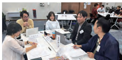
真剣なグループ討論

その後、代表取締役は親族が良いと家族からの説得によって(株)儀間不動産に就職することになります。四代目として経験のない職種で、経験のない経営がスタートしました。最初は、何が分からないのか、それすらも分からない状況で専務にいつも怒られていました。