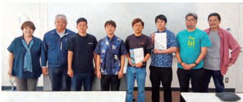
参加したメンバー