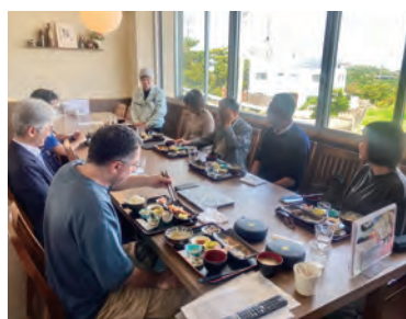
楽しいランチ交流会