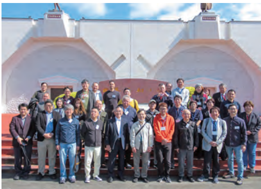
核ミサイル発射台をバックに集合