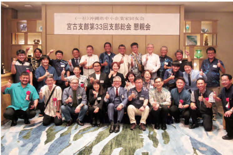
懇親会の全員集合