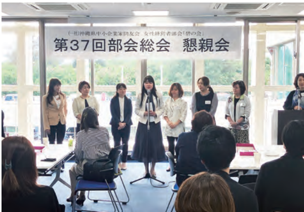
懇親会で役員紹介

でき、俯瞰して見る事の大切さを学んだそうです。碧の会メンバー皆からの協力や、そこから達成感を得られた経験談のお話は、経営にも繋がっているのだろうと、勝手ながら解釈しました。 社長就任当時、地元業界内の組合では唯一の女性でした。女性一人でも臆せず、それどころか年上の男性をも巻き込むリーダーシップや、現在も多角的に新規事業を立ち上げていくその果敢な姿勢に大変刺激を受け、学びの大きい貴重な講話となりました。