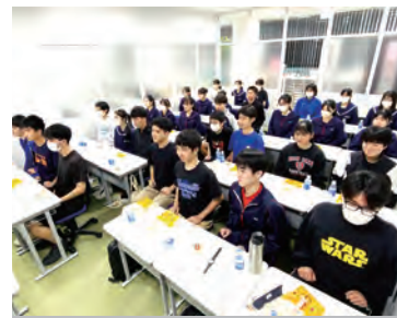
出発式(センター教室)