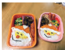
子どもの弁当作りも

孝也さん自身も六人の子どもを育てる父親。「晩酌よりも家族で過ごす時間を大切にすること」を意識して、週末はNetflixで家族と一緒に映