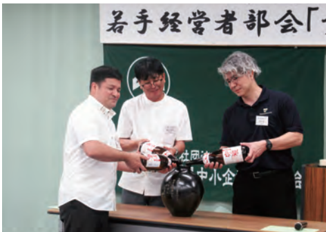
卒業の儀式「甕仕込み」