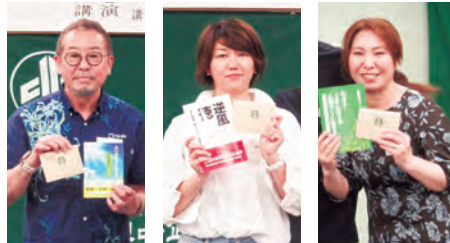
支部長から特別表彰された3氏