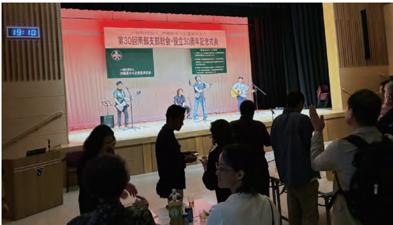
さわやかバンドの演奏で盛り上がる

式典の最後には、ふるいちやすし監督の映画『CITIZENS「戦わない」という選択』の特別試写会が行われました。この映画を作るに至ったきっかけや監督と沖縄との関わりがこの作品にどん