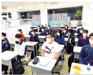
出発式(オープン教室)