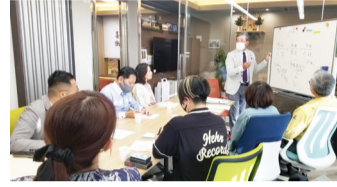
石川会長から説明

三月十日、しらす会の会員企業見学会第2弾が開催されました。今回は、(株)ジムキ文明堂のJ B大山オフィスに