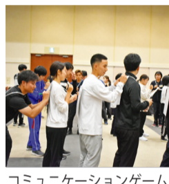
コミュニケーションゲーム

美しい肌のために ① シミを薄くするビタミンE シミを薄くしたり消したりする栄養素の代表格はビタミンEです。ただし、天然に限りません。ビタミンEは体内でビタミンCとリンクして働いていますので、ビタミンCと一緒に摂りましょう。