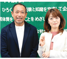
同友会つてどうゆう会?に参加の新会員さん

考えている方や起業したばかりの方は、悩みや課題を解決するヒントや支援が得られるかもしれません。ぜひ一度訪ねてみてはいかがでしょうか。(事務局)