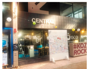
Startup Lab Lagoon