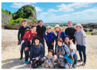
歴史を学びながら交流

に取ったり、三六〇度の自然を満喫しつつ、約一時間半をかけて具志頭浜にたどり着きました。途中、不発弾処理施設跡や、大砲台といった戦争遺跡があり、一般人を巻き込んだ戦争がこの地で行われていたことに胸が痛みました。浜で合流してひと休みした後、別ルートで戻り、最後は近くの「南