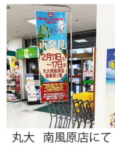
丸大 南風原店にて

二月十一日(土)十七日(金)の期間、スパー丸大南風原店にて、ビジネス連携部会「ゆるゆる」の第四回島のいいもの再発見フェアが開催されました。出展企業は、もちろん全て同友会会員企業。(株)