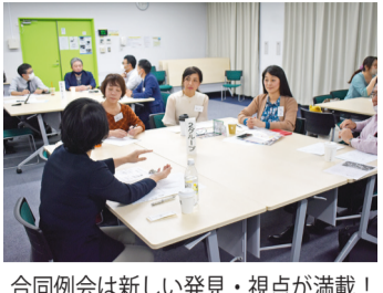
合同例会は新しい発見・視点が満載！

三月十七日、第五十五期経営指針作成講座報告会・修了式が沖繩産業支援センターにて二十七名（内、受講生十四名）の参加で開催されました。受講生は全五講を通して作成した経営理念・十年ビジョン・経営方針の発表を行いました。参加者から質問やアドバイスを受け、さらにブラッシ