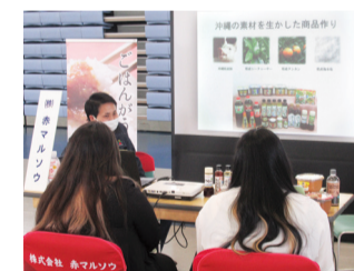
(株)赤マルソウブース

三月六日、沖縄コンベンションセンター展示棟にて「第一回合同企業説明会」が開催されました。参加企業は、沖縄二十六社、東京五社で十七名の学生が参加しました。同友会の合同企業説明会は、ブースに経営者がいて話せるのが一番の魅力です。説明会に参加した学生からは「社長と直接話せるのがとても良く、会社経営を細かく説明してくださるのでここで働きたいなって思う会社もあった」などの感想があつた。この日は二〇二四年度三月卒業予定の大学・専門学校で、みなさん各企業ブースを熱心に回っていました。第二回は六月二十六日(月)に沖縄コンベンシ