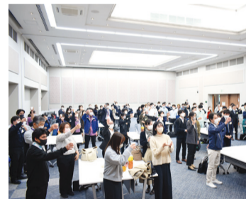
成長発表から交流会へ