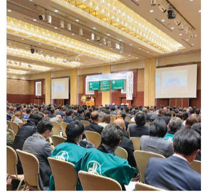
全国から同友会会員集う！

た」とありまして。次回の開催地は来年三月七日・八日に三重県にて開催されます。ぜひ沖繩から一緒に参加をしましょう。（事務局）