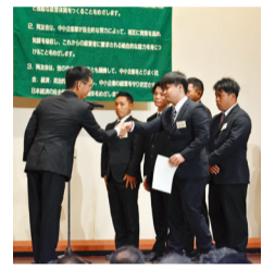
合同入社式の辞令交付

これから始まる新人フォローアップ研修会の第一歩となります。三十五社九十一名の新入社員と四十二名の付添者で始まった合同入社式は、肅々とした空気の中、各社社長より辞令交付を行い、新入社員二名から決意表明がありました。