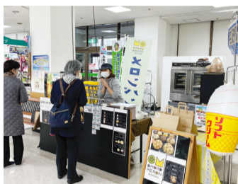
同友会企業がずらり!

みやぎ農園/龍華(株)プログレス31/有勝山シークワサー/農業生産法人(株)又吉観光農園(二社)インフラコントロール/有沖縄長生葉草/有国際企画/有梯梧/有日本健康研究所(株)美らイチゴ/有食のかけはしカンパニー/有ソノクエスト(株)。ビジネス連携部会「ゆるゆる」6次産業化委員会主催で、県内で経済が循環できるような仕組みづくり「地産地消」を