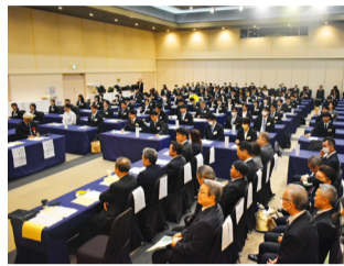
来賓を迎えるの辞令式会場

四月四日～五日の二日間、ユインチホテル南城にて二〇二三年合同入社式・新入社員研修会が行われました。「コロナ禍」でも試行錯誤しながら、開催を続けており、今年度は「コロナ」以前の内容となりました。