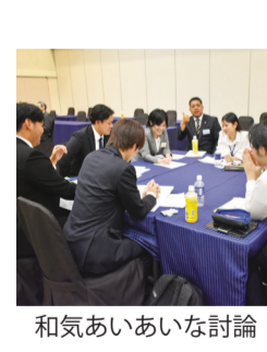
和気あいあいな討論

④ 粘膜と皮膚のバリアは ですが、大人の吹き出物、イボ、タコ、おできなどはビタミンAの不足で起こることが多いです。冬になるとお肌の乾燥が気になると思いますが、潤いがある事で守られている肌のバリアを強化するために、冬はビタミンAの必要量が増えます。顔、ウエストや胸、肘、かかと、背中などが乾燥したり、痒くなる方は不足している可能性があります。体内で使われる時にタンパク質の専用トラックで運ばれますので、タンパク質も一緒に食べましょう。冬にみかんなどをたくさん食べると、せつかく摂ったビタミンAがタンパク質不足でうまく使われない柑皮症という症状が起り、手のひらが黄色くなったりします。効率よく使ってもらうために、肉や魚卵などを積極的に食べましょう。