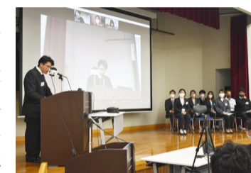
受講生から終了発表