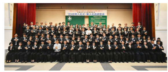
WBCのペッパーミルポーズで終了！

野菜に含まれるビタミンAは、熱と油によって繊維の中から引き出されず、にんじんジュースで飲むよりは、油を使って加熱すると効果的です。例えば人参しりしり、肉じゃがやカレー、シチューなどは、その良い例です。 ここには書いていないその他にも理由はいろいろ考えられます。栄養はリンクしています。どれも試してみてもうまく解決しない方は私にご連絡ください。