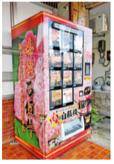
コロナ禍で始めた自販機