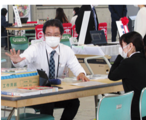
(有)たけ事務ブース

チャレンジコース(一回のみ)での参加や見学会も行いますので、ご興味のある方は事務局までご連絡下さい。(事務局)