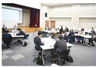
役員と事務局員と一緒に学び討論