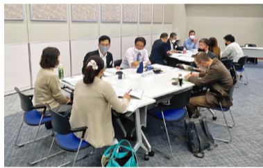
ベテラン会員から新会員までツールを模索

グループ討論では、「今回のワークを自社にどう生かすか」のテーマで討論し、あるベテラン会員より「我々経営者は、経営指針書に基づく経営を行い、その分析を行うためのツールが企業変革プログラムにはある」とのお話があり、自社の現在の強みや弱み、社員や顧