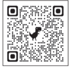
〈入会申込フォーム〉