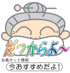
会員ホット情報 今おすすめだよ!

感染症の影響が出始めた昨年と時期を同じくして本店の近くに二店目をオープン。飲食店やホテルに自粛要請があり、売上も激減する中、かなり厳しい状況でしたが、抱いていた構想に向け、躊躇することなく歩を進めました。自粛解除後のイメージ