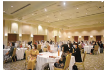
熱心に聞き入る参加者

自身が絵本育児を実践してきた仲宗根氏。航空会社の忙しい勤務の中でも、日々、子供と絵本を共有する時間を持つことで、子供の言語・想像力