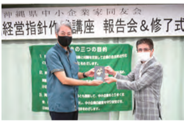
普天間経営委員長(左)より盾の授与

せること、能力の高い個人に依存するのではなく、仲間と一緒に成功を再現できる組織・仕組みづくりが重要と語りました。コロナ禍の取り組みでは、新規事業としてコンドミニアムホテルをオープンした直後、コロナ禍に見舞われた事例を報告。危機的な状況に陥るも、大胆な思考変革、スピーディーな経営戦略の転換、超高速PDCA等によって乗り越えまし