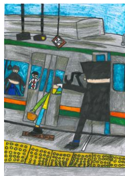
第14回雇用・就労支援フォーラム 最優秀賞作品

★今回も絵画を募集しています★ 締切：9月15日(水)必着 沖縄同友会事務局宛 (那覇市宇小禄 1831-1 沖縄産業支援センター603)