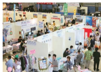
⑧ たくさんの来場者で溢れました