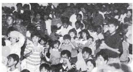
③ 同友会はじまって以来の大イベント