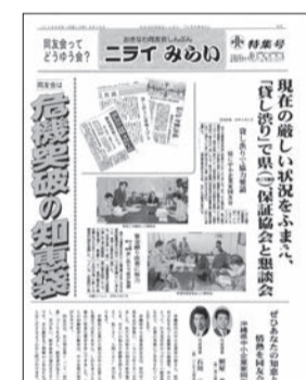
⑦ 貸し渋りの特集号を発行