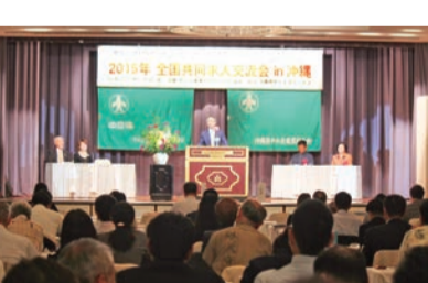
⑫ 共同求人全国交流会

⑫ 第二十六回経営研究会 & 二〇一五年全国共同求人交流会を沖縄で開催 (第334号・二〇一六年一月号)