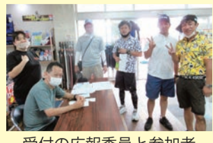
受付の広報委員と参加者

四〇〇号記念ゴルフ大会が、五月八日、守礼カントリークラブ（那覇支部会員）で開催され、五十三名（北部六名、中部八名、浦西十名、那覇二十三名、南部六名）が参加しました。