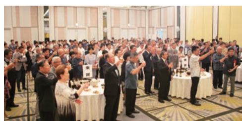
⑬ 創立30周年経営研究会