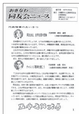
① 沖縄同友会広報紙創刊

淑哲氏、糸数哲夫氏のあいさつ。また、会員一〇〇名達成をめざそうと、呼びかけもしています。