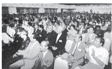
⑥ 中同協総会に全国から集まった参加者