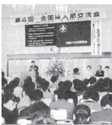
④ 沖縄初の全国行事