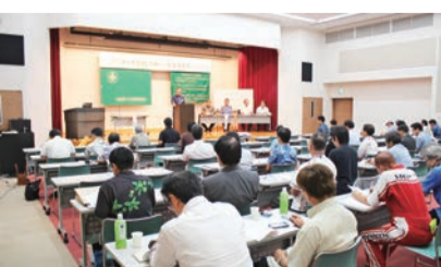
⑭ ゆいま〜る設立総会

⑫ 第二十六回経営研究会 & 二〇一五年全国共同求人交流会を沖縄で開催 (第334号・二〇一六年一月号)