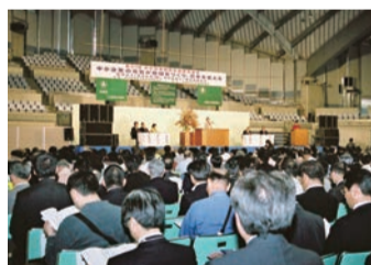
⑨ 全研、同友会運動への誇りを再確認