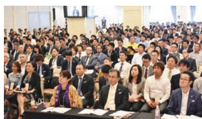
⑮ 青年経営者全国交流会

⑮ 第四十六回青年経営者全国交流会を沖縄で開催 (第369号・二〇一八年十二月号)