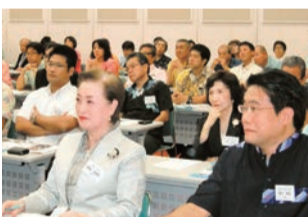
⑪ 1,000社というたくさんの仲間ができました