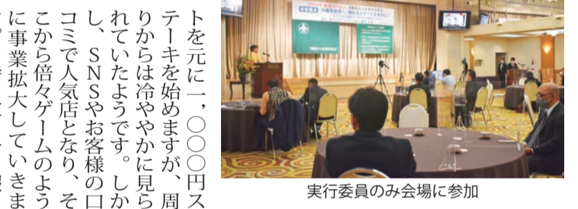
実行委員のみ会場に参加

義元氏は、飲んだ後の締めにもステーキを食べて「やつぱりステーキは「やつぱりステーキ、飲食業をスタートさせます。アメリカで食べたステーキの味を再現したい」との思いや、コンサルタントで培ったコンサル