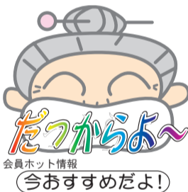
会員ホット情報 今おすすめだよ!

す。だからこそ、ストレスのない環境を構築する事が、これからの企業の強みともなると語っており、自社も他社も、そして個人をも守っていきたくてといった会社の勢いを感じました。情報格差を