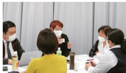
グループ討論で学びを深める参加者

日本財団が二〇一三年からサービスの普及に努め「(株)アイセック・ジャパン」は通訳オペレーター業務を担っており、ようやく二〇二二年から国が制度化します。一瀬氏からは、聞こえる