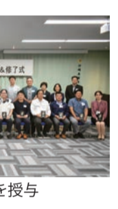
修了生には盾を授与

苦労した経営指針の作成は、今後の企業経営において必ず生きてきます。全員で共有すること、社員に浸透させ、実践することが大切です。受講をされていない会