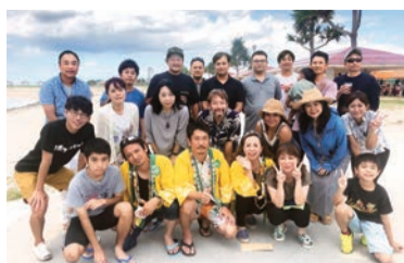
集合写真をパチリ

十月十日、豊崎ちゅらSUNビーチにおいて、那覇支部西地区うりずん合同ビーチパーティー&うりずん卒業式が開催され、四十三名が参加しました。冒頭行われたうりずん