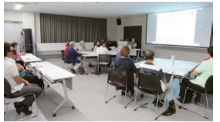
Zoom併用で学びを共有する