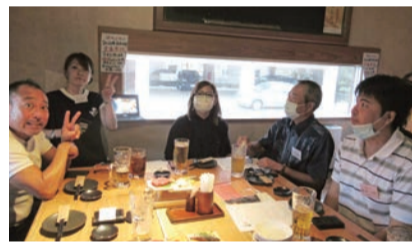
和気あいあいとしたグループ討論

最後は、「受け身ではなく積極的に沖縄同友会の行事に取り組みたい」と会員から頼もしい発言もあり、有意義な会となりました。