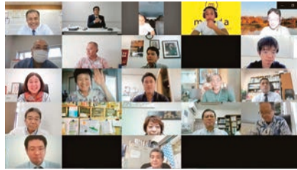
講演後の質疑応答で学びを深める

グラフ化し、日本型特徴を把握。感染者が出ても抑えることができる国同士から交流再開することが導かれました。年齢別感染者数、さらに都市部や観光地での感染拡大状況分析より「三密・飲酒・大声・換気不全」を避けるのが有力な予防法であることが分かりました。沖縄観光再建への糸口になるインバウンドの実相と分析結果は、訪日客には滞在型とリピーターを増やし、日本人客には沖縄県内旅行活動と消費を上げる企画が重要であることを示しました。