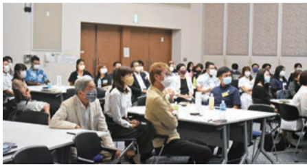
報告に聞き入る参加者

しかも、継承時はマイナズからのスタートで資金繰りに追われる日々。子育てしながらでもあり、まさに無我夢中で毎日を送っていた時に、同友会と出会い経営指針作成講座を受講します。