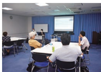
報告を聞く参加者

今回は、事務機やオフィス家具を取り扱っている(株)サンコーをご紹介します。 昭和四十九年創業なので、なんと今年で四十六年目を迎えます。創業時はキヤノン商品を主として事務機器の販売から始まり、コクヨ沖縄販売(株)やエプソン販売(株)、(株)本HPなど多くの商品を取り扱う販売店として大きく成長しています。今ではシステム開発、ホームページ制作など事務機