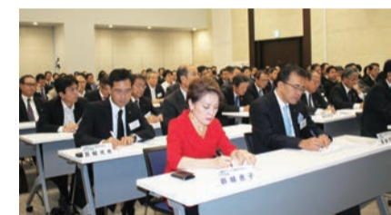
熱心に耳をかたむける参加者

性評価によって、中小企業家は、経営指針に基づき、人材を大切にしながら、しっかりとした経営を行うことが問われる。銀行マンは、より多くの現場を回り、経営者との