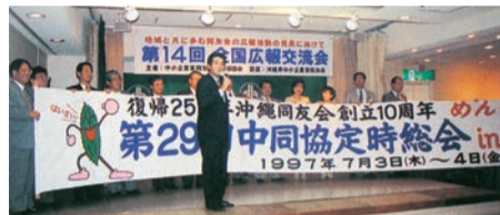
全国総会をアピールするため沖縄で開催された第14回全国広報交流会にて（1996年10月）