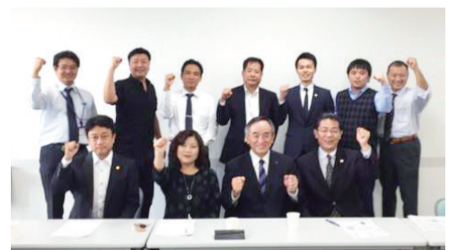
皆で1250社達成頑張るゾー!!

今年度、残すところあと三カ月となりました。組織委員会では、この三カ月を「仲間づくり躍進月間『春の陣』」と銘打って、一二五〇社を必ず達成する覚悟で臨みます。