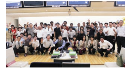
「ニライみらい」300号記念ボウリング大会

沖繩同友会三十周年、私が入会した年は十周年の年でしたから二十周年の年になります。入会当初六百五十社程だったと思います。今や、一千社を超える組織になり、これまで以上に多くの提言や実践を積み、学ぶ経済