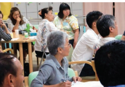
中部支部で開催された共育寺小屋