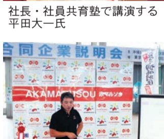
第2回合同企業説明会の様子