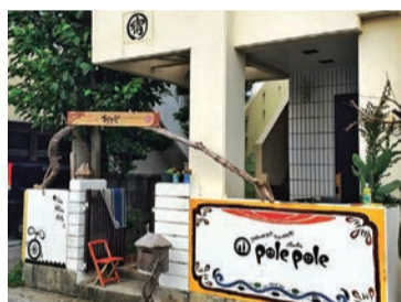
優しく迎えてくれる雰囲気のPOLEPOLEの外観

で、同時期に滞在した男女がカップルになり結婚された方もすでに二組もいるというから驚きます。それだけ、アットホームでくつろげる宿という証でしょう。また、お客様に対して、門限などのルールやNGなどは作らず、みんなが自然体でいられる場を心がけているそうです。「日々の生活に疲れている方たちが、うちに来て癒されて元気になって帰って