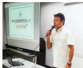
1150社達成パーティーで小松組織副委員長より同友会版紙芝居を発表