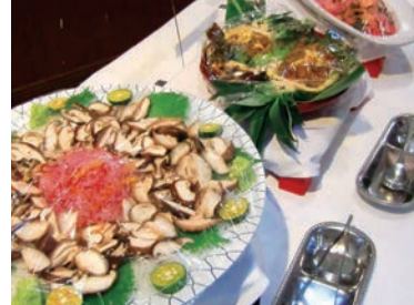
北部支部6次産業学習会