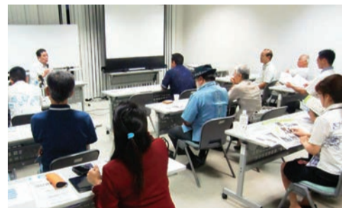
トラムについて学んだエコま〜る例会