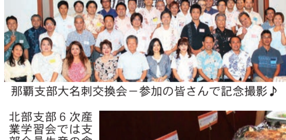
那覇支部大名刺交換会 -参加の皆さんで記念撮影♪