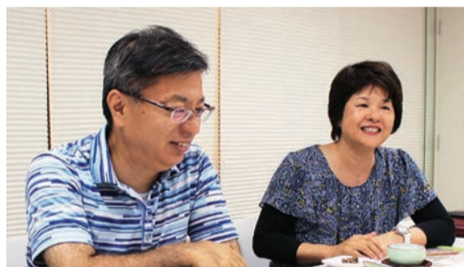
奥様と二人三脚で・・・

ごし、ワイワイガヤガヤと会社のことを語り合う最高の時間です。 当事者意識 「伝えたつもりが社員に伝わっていない現実」に所長として反省することもあります。自社の夢目標を叶えるために、システム手帳を行動ツールとして活用しています。