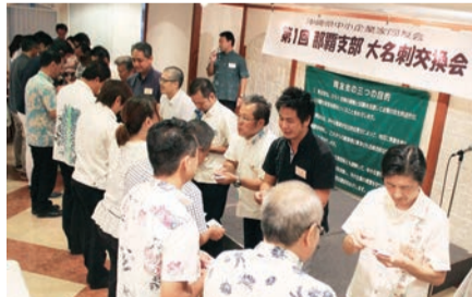
那覇支部大名刺交換会の様子