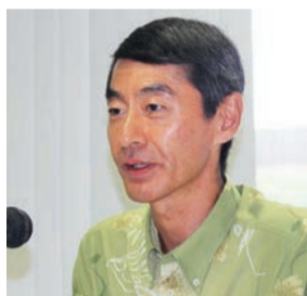
同友会大学第11講で講師を務めた日銀那覇支店長の蒲原為善氏