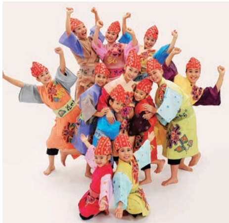
元気いっぱい演舞する花やからの子供たち

9月29日に沖縄産業支援センターにて「1150社達成パーティー」が開催されました。残念ながら、目標の1150社達成はできませんでしたが、今年度目標の1250社達成に向けて、さらに各支部で仲間づくりをすすめることを再確認しました。席上では、同友会を説明するツールとして「紙芝居」が紹介されました。