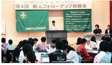
第4回新人フォローアップ研修会では受講生が発表者をつとめた