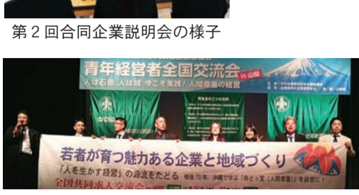
青年経営者全国交流会in山梨で、11月に沖縄で開催の全国共同求人交流会をPR