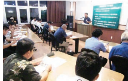
北部支部6次産業学習会