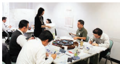
戦略マネジメントゲーム研修会