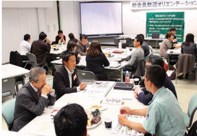
同友会ってどういう会なのかを先輩会員さんから学ぶ -新会員オリエンテーション