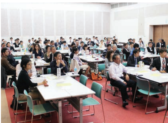
真剣なまなざしの参加者