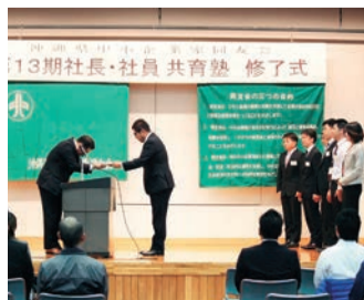
年間通して学んだ社長・社員共育塾の修了式