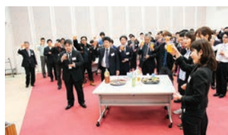
社長・社員共育塾修了式と懇親会