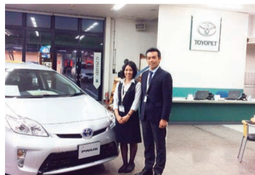
社員とプリウスと共に