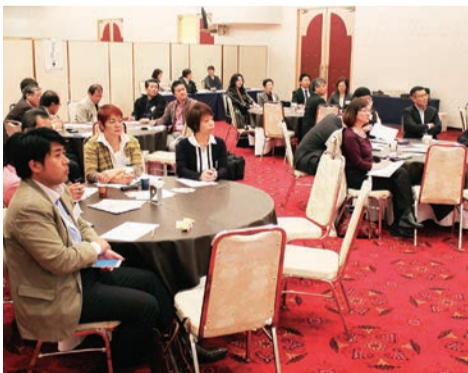
ビッグ対談例会の参加者