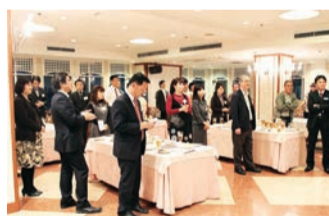
大勢の参加者が集まりました -那覇支部名刺交換会