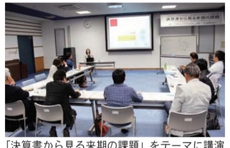
「決算書から見る来期の課題」をテーマに講演 -北部支部やんばるじんぶん塾