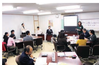
八重瀬町で開催された南部支部例会