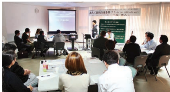
若手経営者部会「うりずん」部会例会