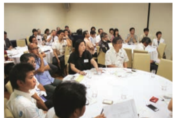
パネリストの話聞く参加者

この問題は親子で連鎖するといふ特徴もあり、十二歳以上の女の子がよい環境で育つことの重要性を訴えています。小さな事でも彼らにとつて大きな喜びの一步になるのであれば、今、私たちができる事を考えて行きたいです。(トマトプリン ト・知念由紀)