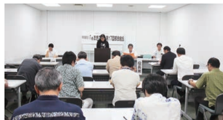
eおきなわの活動報告をする役員

五月十九日、情報関連部会「eおきなわ」第十七回部会総会が沖縄産業支援センターにて十九名の参加で開催されました。