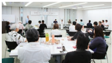
共育塾の良さをPRするパネリストの皆さん

五月十六日、沖縄産業支援センターにて社長・社員共育塾説明会が二十三日三十三名の参加で開催されました。コ