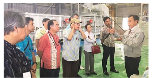
説明を熱心に聞く参加者