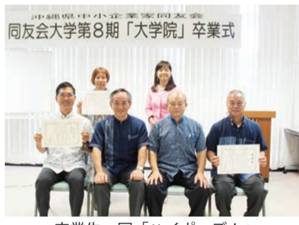
卒業生一同「ハイポーズ!」