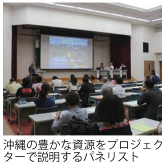
沖縄の豊かな資源をプロジェクトで説明するパネリスト

入社から三ヶ月の新人社員。そろそろ戦力として成長していきませんか。早期戦力化のために中小企業の人材育成はOJT(オンザジョブトレーニング・職場内教育)が中心。OJTは、職場の上司や先輩が、後輩に対して仕事に必要な知識・技術・技能・態度などを組織的・計画的・継続的に指導し、全体的な業務能力を育成する活動です。