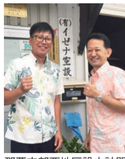
那覇支部西地区設立訪問