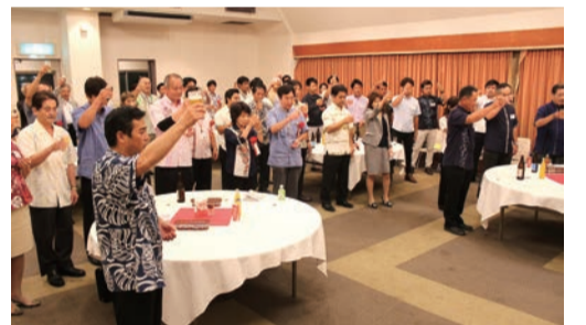
新年度も活発な会活動にという願いを込めてカンパイ!

① 新人に学ばせ、安心させる。味をもたせ、安心させる。② 作業を見て見せる。根気よく説明、質問し、一度力を育成する活動です。OJTは第一次世界大戦の米国で始まったとされています。戦時下で大量の造船作業をするために多くの作業員が必要になりました。熟練された作業員が不足したため新人を早期に育成するために、育成担当者のチャールズ・アレンが訓練プログラムを作成したのが始まりと言われています。その進め方は、① 新人に学ばせ、安心させる。味をもたせ、安心させる。② 作業を見て見せる。根気よく説明、質問し、一度