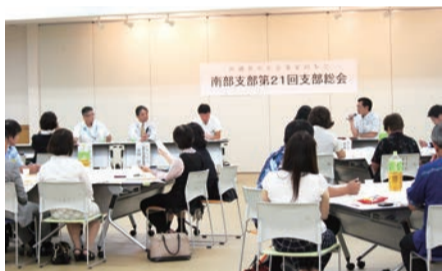
パネルディスカッションで条例について語るパネリストたち

五月十七日、沖縄産業支援センターにて、那覇支部第十八回支部総会が百名の参加で開催されました。 第一部「総会議事」では「元気な人と企業づくりで、地区・支部のさらなる組織強化を！」のスローガンの下、支部・地区活動も人づくり、企業づくりに力を入れ、例会や勉強会で「労使見解」を学び、「人を生かす経営」の総合実践に取り