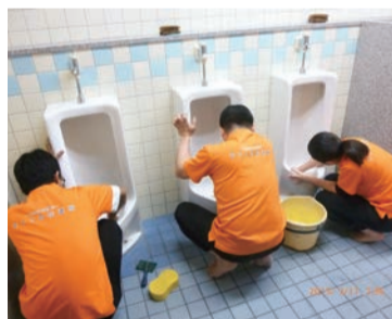
トイレ掃除をする社員の皆さん

今期から代表三名制となりましたので、多忙な役割を分担して、第六次ビジョンの達成を目指します。