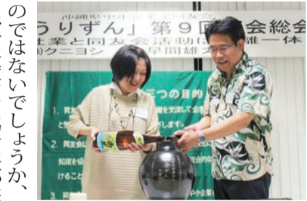
「うりずん甕」に泡盛を注ぐ

第九回「うりずん総会(若手経営者)」 初・特別例会でグループ討論を行い、学び深める