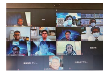
熱心に聞く参加者

七月三十日、沖縄産業支援センターとZoomも併用して、ビジネス連携部会「ゆいまゝ」7月部会例会が二十四名(うち、Zoom十名)の参加で開催しました。「連携できる強みを生かし、今こそ企業にITを導入しよう」が、この