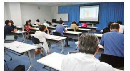
講師の話真剣に聞く参加者

型コロナウイルスにも対応でき、ハザードマップも活用し災害リスクを把握することもできると紹介。経営環境の変化に対しても有効な事業継続戦略を事前に準備することがこれからの企業経営において不可欠であり、BCPを策定し地域に必要な強い会社を目指そうと強調しました。最後は質疑応答を行いました。（事務局）