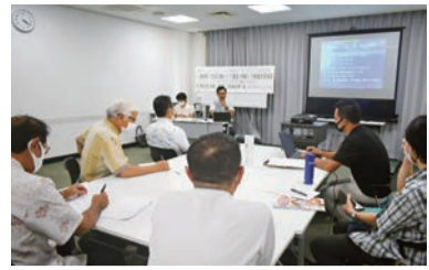
宮城氏の報告を聞く参加者

また、同友会 MONEY 券が利用できる受付店舗を追加募集しています。申し込みについては、沖縄同友会事務局（TEL: 098-859-6205）までご連絡ください。