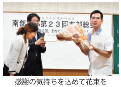
感謝の気持ちを込めて花束を

五月二十二日、南風原町中央公民館にて南部支部第二十三回支部総会が四十八名の参加で開催されました。