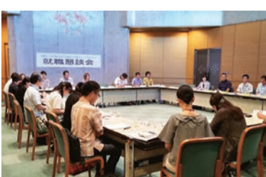
意見交換する参加者

参加者からは、学校との情報交換を踏まえ、今後の採用活動に活かしていきたいとの声もありました。共同求人委員会では、このあと、専門学校や高校の就職担当の先生方と懇談会を予定しています。特に、高校とは昨年二度開催しました。採用難の中、なんとか人材確保に繋げようと学校訪問の充実や門前でのビラ配布、jobwayの活用など様々な活動に取り組んでいます。(事務局)