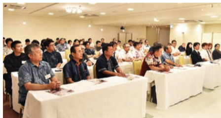
今村氏の活動に感動する参加者