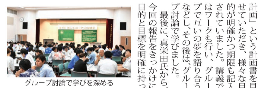
グループ討論で学びを深める