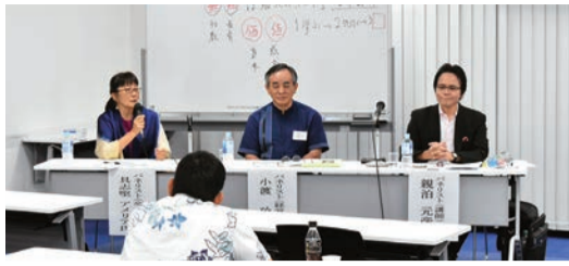
パネリストのみなさん