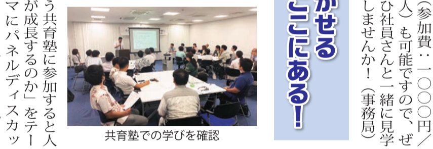
共育塾での学びを確認