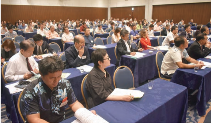
総会に出席の会員の皆さん

一九九九年の「二十一世紀同友会型企業づくり」にて市場創造と人材育成を学び、「今ある仕事はなくなり、今いる社員は必ずなくなる」として、自社の未来創造を描きつつ、長期的視点での採用・育成を互いに教えある風土づくりに注力します。ノウ・ハウでなく、ノウ・ホワイと社員の意識を変化させ、現状に甘えるのではなく常に「危機感」を持ち、「危険+機会」の認識が、「会社は将来に向かって発展する秘訣」と語ります。