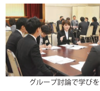
グループ討論で学びを深める