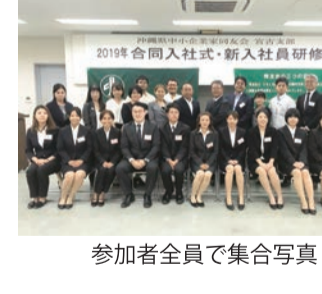
参加者全員で集合写真

研修会終了後は居酒屋で懇親会。新入社員同士、研修の感想等を和やかに語り合い、最後はLINE交換。晴れて同期仲間となりました。(事務局)