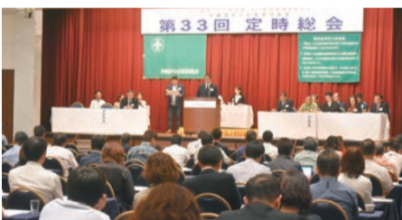
定時総会の一コマ

最大の資源である社員と共に育ちあうために、経営指針の成文化と全社実践をすることで、浸透させていきます。経営指針を全社員と共有していく過程が、最大の「共育」であり、浸透させる過程で、生きがい、やりがい、働きがい、喜び、誇りが持て、働ける職場風土ができると語ります。経営指針の目標に対するフォロー体制は、決算二カ月前に経営指針幹部検討会にて経営指針書を作成し、決算後に経営指針発表会、毎月「予実の差」会議を行い、PDC Aサイクルを実践しています。