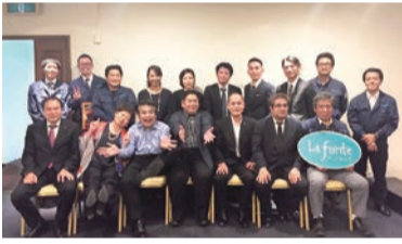
社員全員で集合写真

③コミュニケーションの向上」で、全てはおお客様の信頼を裏切らないために社員の質の向上に取り組んでいます。「社員は家族、みんなでいい仕事をしていこう」と、全員