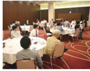
真剣に宮良氏の報告を聞く参加者

ける体験となりました。事業承継のあらゆる事例、身内同士のもめごとや法的な事、これらに関わっていく中で、ご自身の事業承継に活かされることとなったようです。二〇一四年、父と母が経営されていた事業を同時に引き継ぐという壮絶な事業承継となりました。