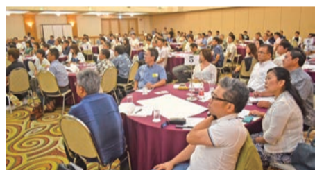
竹中氏の話真剣に聴く参加者

お客さんのせいにするが、売れるお笑い芸人は自分から変わろうとする、よしもと興業にいた時代にお笑い芸人の特徴を見て気づいたとのこと。売れる芸人は、お客さん目線にたつて常に違うネタで挑んでいます。