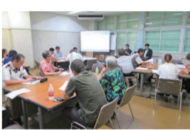
経営指針作成講座について学ぶ

自分学んだ豊富な現場経験を自信をもって、鮮やかな仕事ぶりで魅せましよう。笑顔と気配りも忘れずにね。