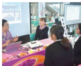
説明を真剣に聴く学生

七月十八日、沖縄コンベンションセンター展示棟にて、「きらりと光る会社発見フェア」を開催しました。