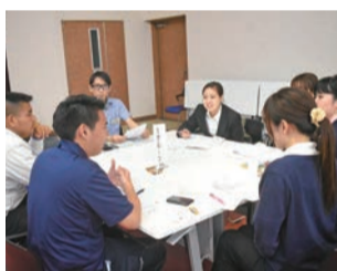
討論で学びを深める

七月二十二日、沖縄産業支援センターにて、第三回新人フォローアップ研修会が百七名の参加で開催されました。