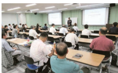
財務会計について学ぶ

二次会として「Queen」と「JET」のライブハウス巡りで幕を閉じ、ダイブなコザの夜を堪能しました。