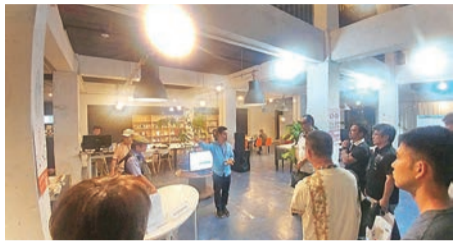
説明を聴く参加者

七月五日、沖縄市観光物産振興協会の協力で、まーさむんロードが会員十名の参加で開催されました。