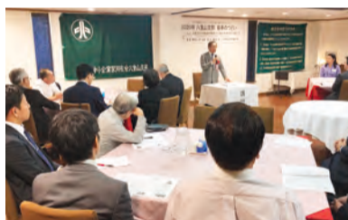
広浜氏の講演を聞く参加者

企業変革支援プログラム「STEP1」の経営成熟度診断は、企業を評価・査定するだけでなく、経営者自身がつくべきこと、これまでの企業活動を客観的に振り返り、今後の展開に生かすことができます。 経営成熟度診断は企業変革支援プログラム「STEP1」の書籍またはe.doyuから診断可能です。ぜひお試しください。