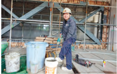
笑顔で作業をするスタッフ

の名刺交換で建設業以外の方には、事業説明も難しくビジネスマッチングもなかなか難しいと笑いながらお話しされ、「画像や現場を見ながら説明を受けないとわかりにくい工事ですが、その内容は既存コンクリート部材と耐震補強となる鉄鋼材の間を接合する特殊施工で、県内でも一台しかないであろう特殊機器を用いてグラウト材と呼ばれる無収縮モルタルを圧入・注入する工事となっています。本土の鉄筋コンクリート造の建物は耐震補強工事が一般的に当