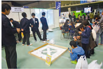
ゲームで遊ぶ子供達

「IT津梁まつり」はビジネス連携部会「ゆいまる」の情報委員会、eおきなわ」と(株)サン・エー