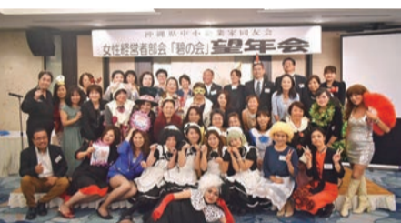
参加者全員でハイチーズ

十二月三日、ホテルJALシティ那覇にて、「碧の会」望年会が四十七名の参加で開催されました。 三十周年の今年は、会員交流委員会が企画し、