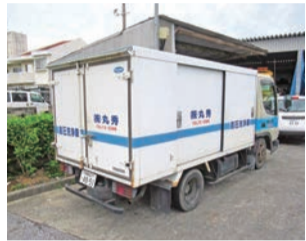
(株)丸秀専用 高圧洗浄車

型で運転コストを低く抑えられ、離島自治体の漂着ごみ処分、インドネシアなど海外でも活躍しています。(株)丸秀は、二十年前から「チリメーサー」を取